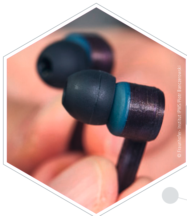
Mit Nanoteilchen wird Platz für eine Internetschnittstelle im intelligenten Kopfhörer geschaffen

Könntest du dir vorstellen, dass das Smartphone bald von Kopfhörern abgelöst wird? Bisher fehlte zur Umsetzung der zahlreichen Funktionen noch eine geeignete Lautsprechertechnologie, die mit der smarten Nutzung kompatibel ist. Ein Forschungsteam des Fraunhofer-Instituts IPMS und der Bosch Sensortec GmbH ist es jetzt aber gelungen, dem intelligenten In-Ohr-Kopfhörer einen Schritt näher zu kommen. Möglich machte es die Mikroelektronik-Technologie. Der entwickelte Mini-Lautsprecher besitzt eine Lautheit von 120 Dezibel, ohne dabei zu viel Energie zu verbrauchen – Voraussetzungen für die Marktreife. Dafür setzten sie zwei innovative Ideen um: Schallverdrängende Technik sitzt nun auf einem Silizium-Chip und die Antriebstechnologie wird durch „Nano e-drive“-Aktoren, einer Art elektrostatischen Hebel, bewegt. Mehrere dieser Hebel werden hochkant in den Chip gebaut und können durch Spannung in Bewegung gebracht werden. Dabei wird Luft aus dem Chip gepresst und Töne entstehen. Diese Technik ist platzsparend und lässt somit Raum für weitere wichtige Bauteile.