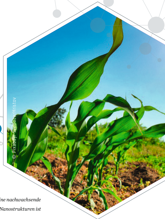
In Tests zeigte sich, dass Mais eine nachwachsende Alternative zur Herstellung von Nanostrukturen ist